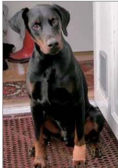
En hund av den här typen skadade treåringen allvarligt.

–?Nu mår han jättebra. Och han är inte rädd för våra andra hundar.